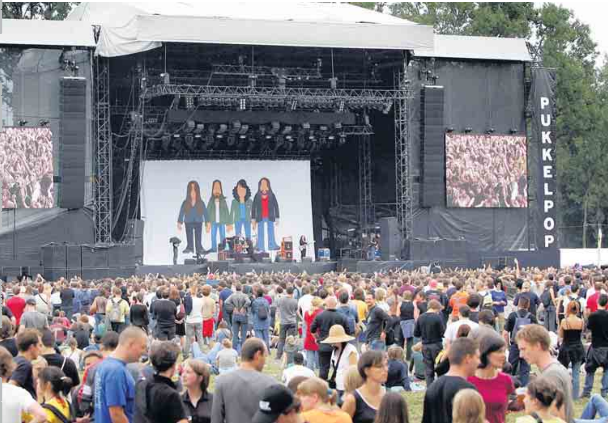
Rock-'n-roll als sociaal-economische en intellectuele hefboom – wie zei daar dat politiek niet sexy was?